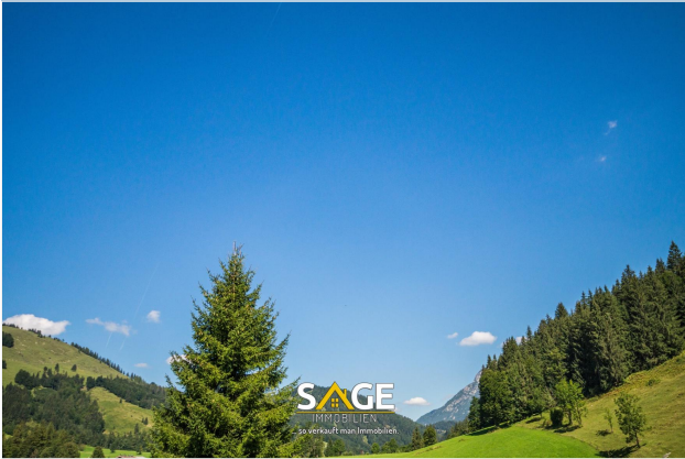
Haus in Hochfilzen