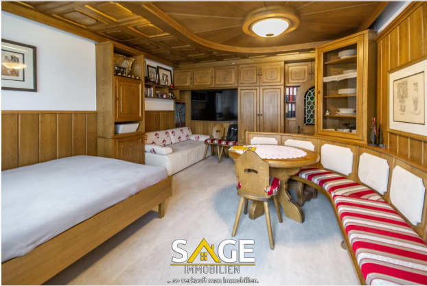
Ferienwohnung in St. Johann